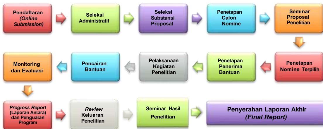
Gambar 4.2: Alur Pengelolaan Bantuan Penelitian Berbasis Standar Biaya Keluaran

Tahapan dan penjelasan masing-masing proses bantuan penelitian berbasis standar biaya keluaran ini, dapat dilihat pada gambar di bawah ini: